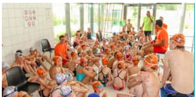
Les jeunes nageurs du Garon Aquatic Club et de l'Amicale Laïque de Chaponost, côte à côte pour le premier interclubs organisé à l'AquaGaron fin mai.