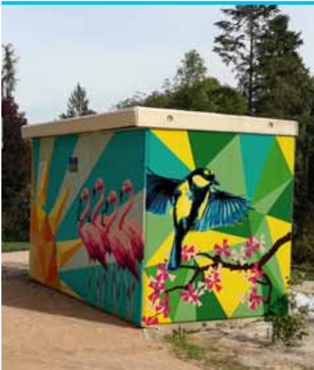
Projet non définitif

La municipalité souhaite favoriser l'implication des jeunes dans la vie de la cité, tout en participant à son embellissement. Suite au succès du projet graff réalisé en partenariat avec la MJC et Enedis, sur le transformateur du Parc Misery en 2016, l'action va être reconduite sur celui situé à l'arrière de la médiathèque.