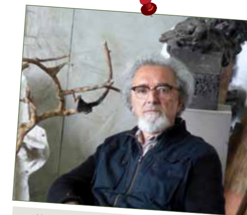
« Une vie de création qui dure depuis plus de 40 ans, sans relâche, et donne du sens à l'existence. »

Cette installation sera complétée par une exposition du 22 septembre au 8 octobre, dans le hall de la médiathèque.