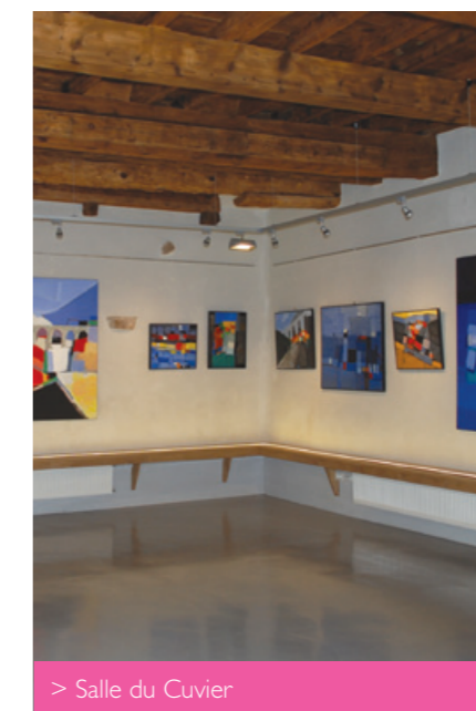
> Salle du Cuvier

> Judi 2 au dimanche 5 juin Photographies de Vivien Laplane