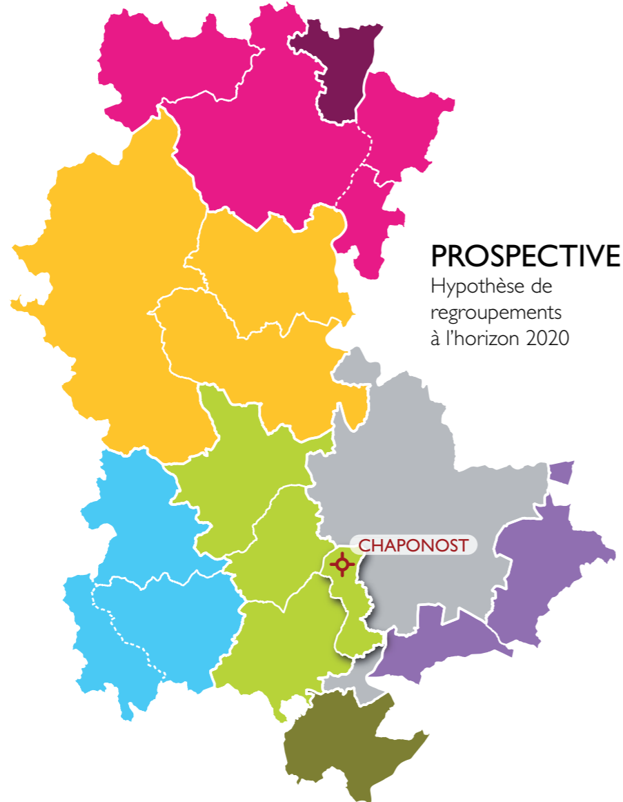
2016