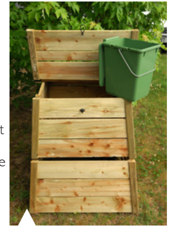
« Le compostage est une démarche simple et naturelle à la portée de chacun, pour autant que vous bénéficiez d'un peu de terrain. »

Nous jetons encore, dans nos poubelles grises, 45 à 60 kg de produits compostables par an et par habitant . En compostant nos déchets ménagers, nous pourrions réduire sensiblement nos déchets. C'est pourquoi le SITOM Sud-Rhône reconduit en 2016 la vente de composteurs à prix préférentiel. Les trente premières demandes adressées en mairie au plus tard le 14 octobre 2016 , bénéficieront d'une aide de la ville de 25€ , quel que soit le volume du composteur choisi, à raison d'une demande par foyer.