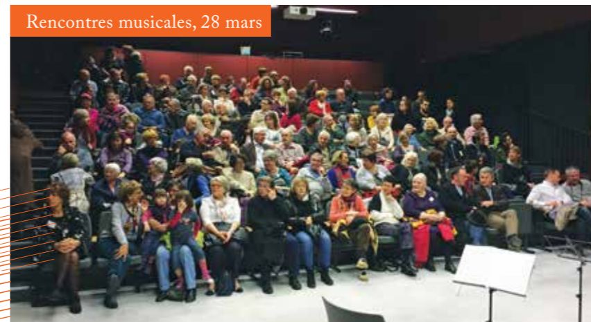
Rencontres musicales, 28 mars

Retrouvez les reportages réalisés en lien avec ces 3 événements sur la chaîne YouTube de la Mairie : Chaponost TV.