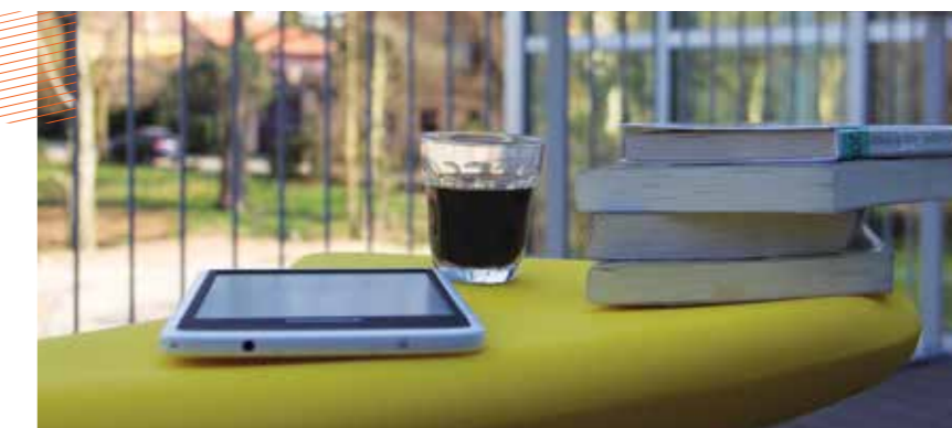
Venez prendre l'air à la médiathèque autour d'un livre, d'un café, d'une tablette...