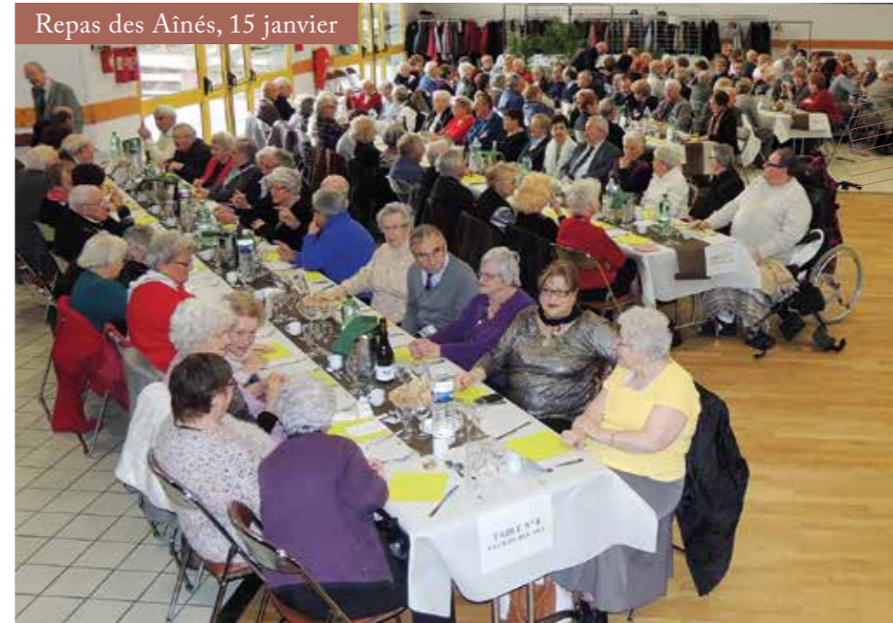
Repas des Aînés, 15 janvier

Le temps d'une soirée, les membres du Conseil municipal d'enfants se sont transformés en petits reporters pour recueillir vos impressions.