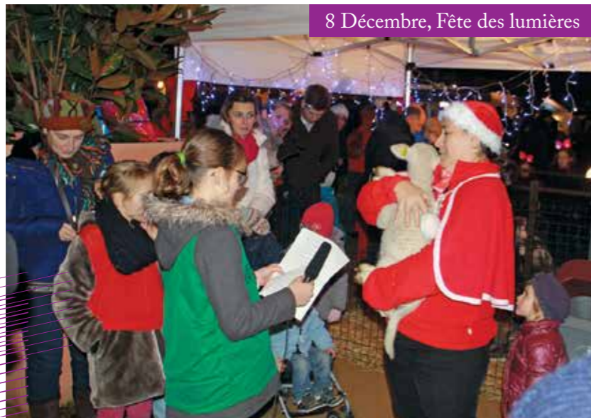
8 Décembre, Fête des lumières

Le temps d'une soirée, les membres du Conseil municipal d'enfants se sont transformés en petits reporters pour recueillir vos impressions.