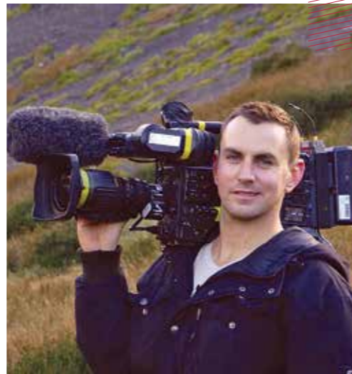
Un garçon aux grandes qualités tant humaines que professionnelles et tourné vers les autres : sa famille, ses amis, ses collègues.

Nous adressons tout notre soutien à sa famille et à ses proches ■