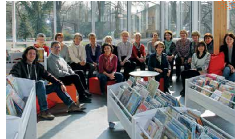
Une équipe de 5 salariés et 15 bénévoles est à votre écoute.