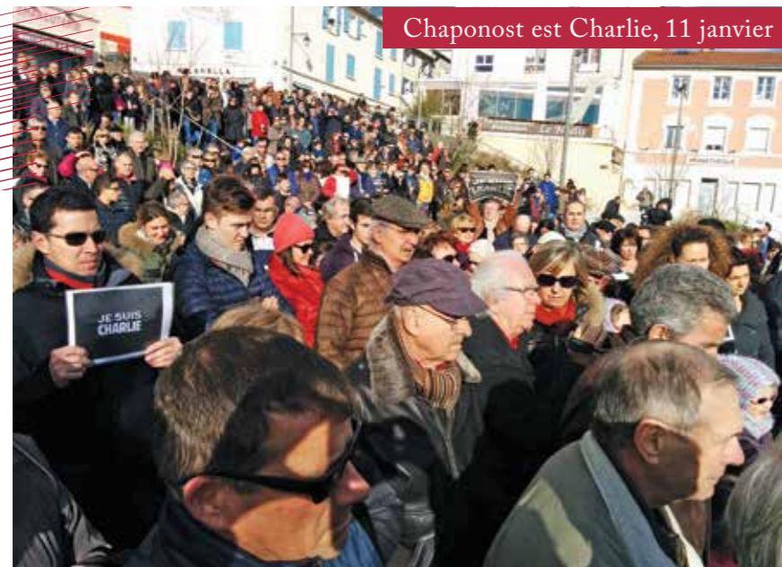
Chaponost est Charlie, 11 janvier

Les 5 réunions d'information autour du dispositif de prévention des cambriolages ont rassemblé près de 600 habitants. 20 référents de quartiers se sont portés volontaires pour la mise en place de ce dispositif.