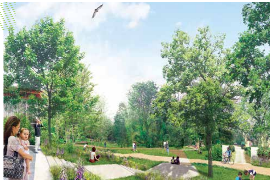
© Atelier Anne Gardoni. Visuel non contractuel. Le concepteur entame désormais un travail d'adaptation afin d'affiner le projet, en fonction des remarques formulées lors de la consultation de la population et des impératifs budgétaires de la commune.

Du 15 décembre 2014 au 17 janvier 2015, les habitants de la commune étaient invités à s'exprimer sur les 3 projets de réaménagement de la place : en Mairie, sur le site Internet et lors de 2 permanences des élus sur le marché. Plus de 300 avis ont été recueillis. Les usagers ont pu faire part de leurs observations sur les modalités d'utilisation de la place. Fin janvier, un Comité Consultatif Urbanisme et Grands Projets élargi aux représentants de l'association des forains, des anciens combattants et de la paroisse, a auditionné les trois concepteurs venus présenter les grandes lignes de leurs projets et échanger autour de leur vision.