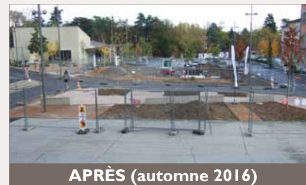
APRÈS (automne 2016)