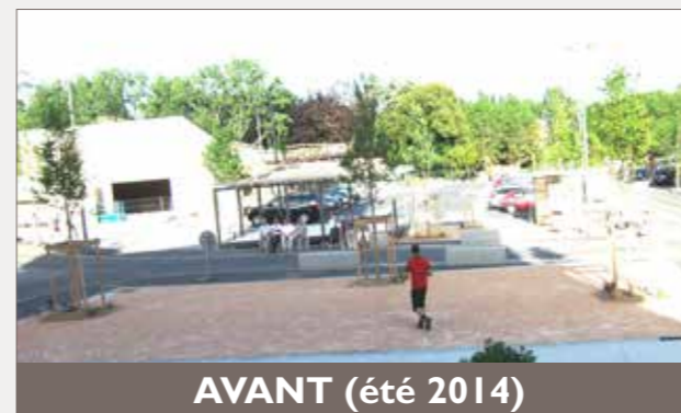
AVANT (été 2014)