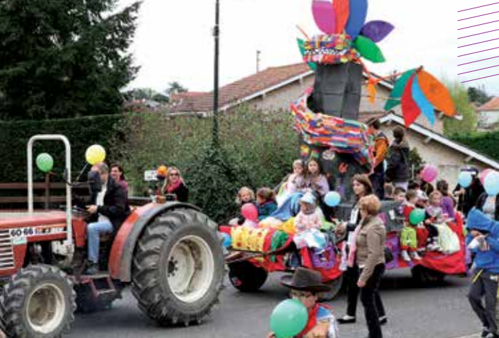
Carnaval d'1,2,3 Parents, 5 avril