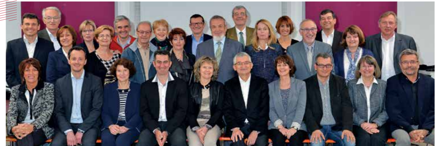
Les Conseillers communautaires de la CCGV

27 mai au siège de la CCGV / 262 avenue B. Thimonnier à Brignais.