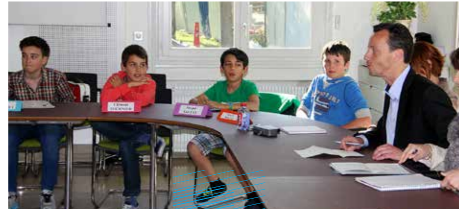
Séance du Conseil Municipal des Enfants, 16 avril